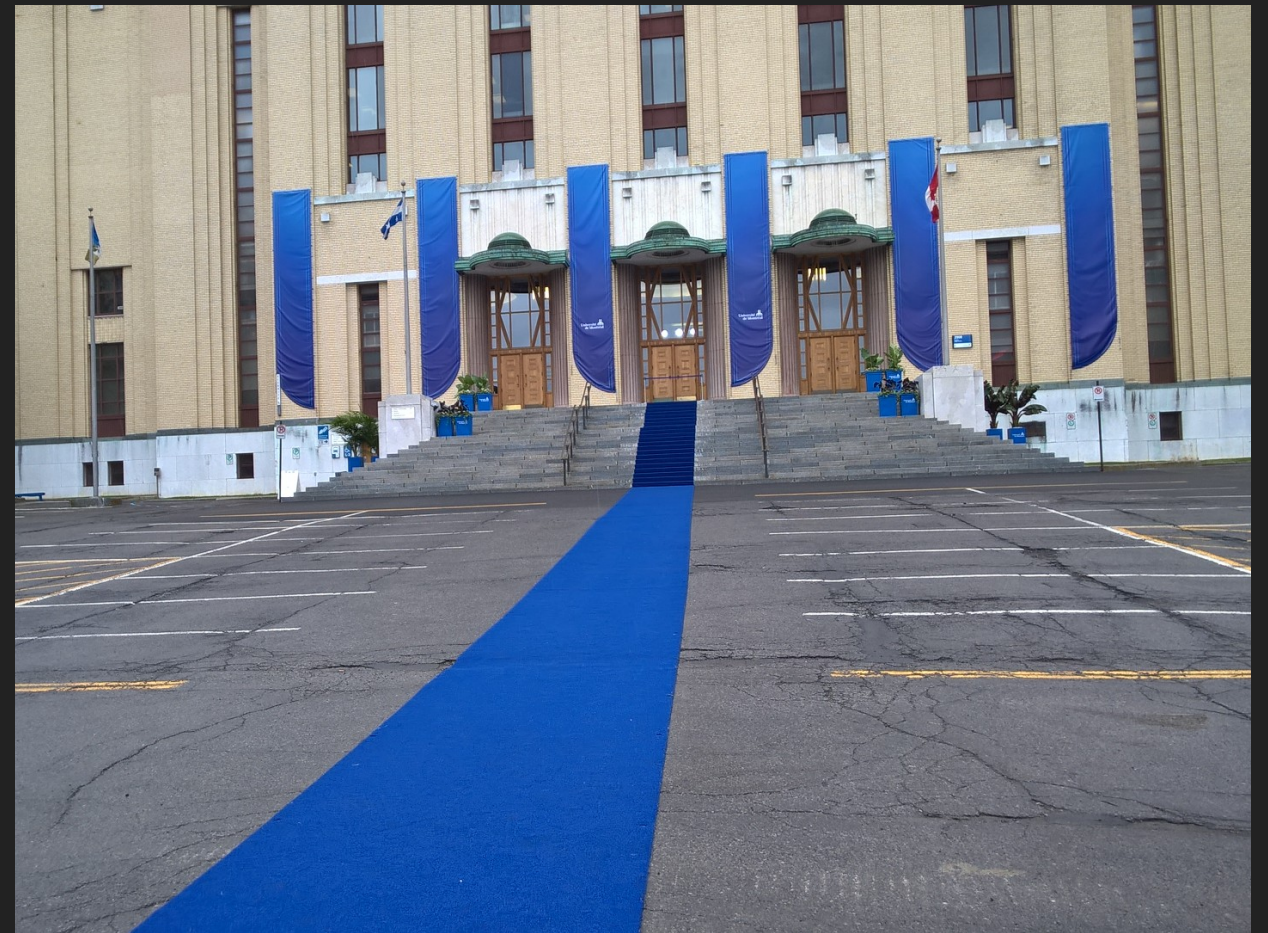
Le tapis bleu pour les diplômés