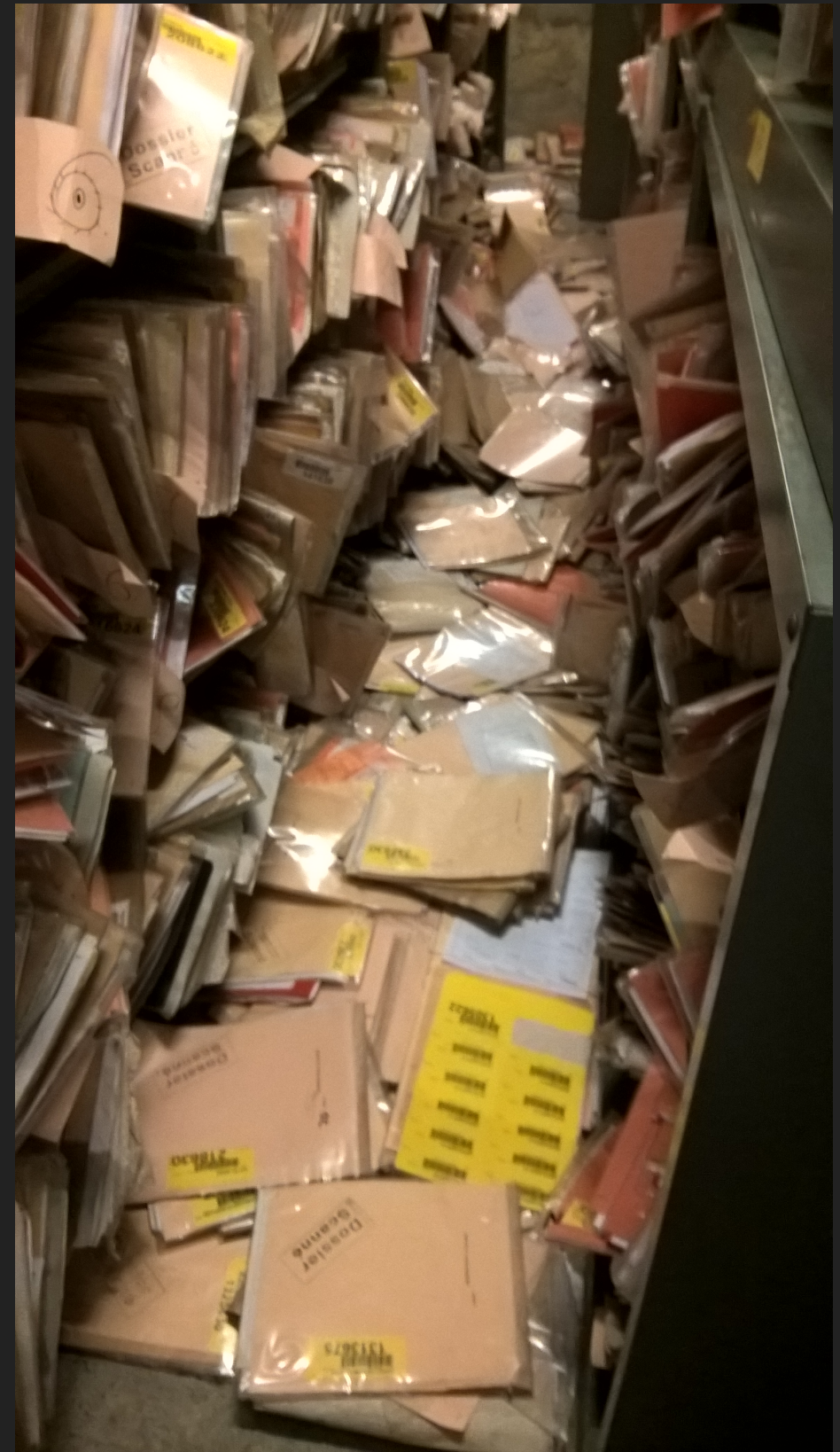
Un véritable chantier