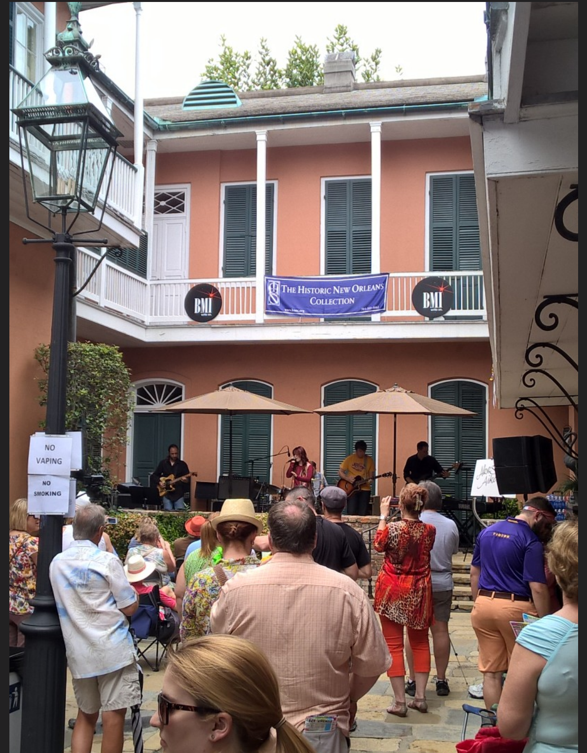
Welcome to NOLA