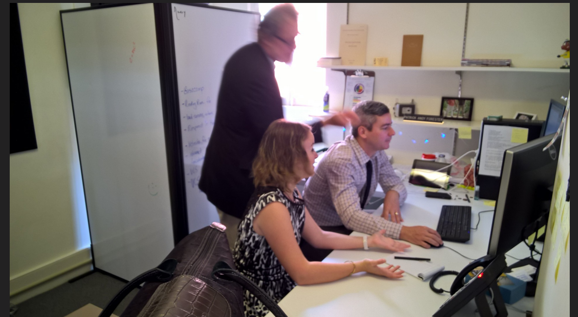
La fine équipe...