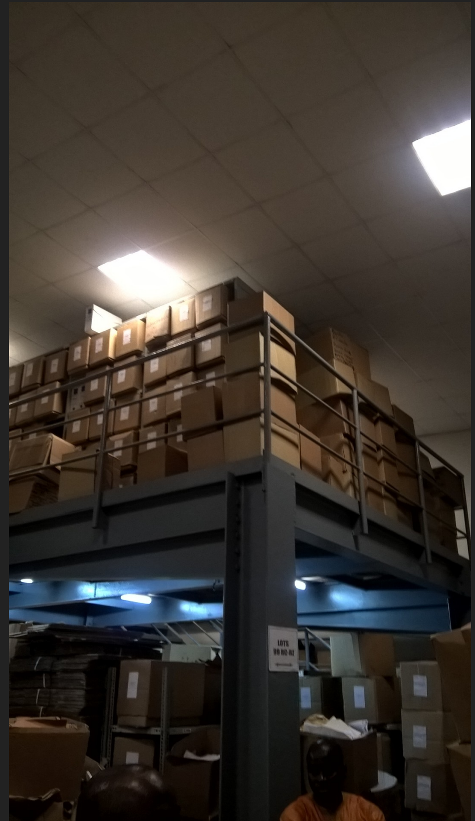
Stockage des archives à Abidjan